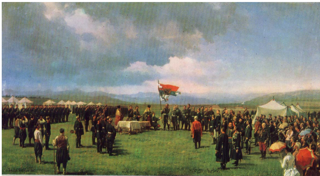
„Връчването на Самарското знаме на българските опълченци”, художник Н. Димитриев-Оренбургски

Б) Кой руски генерал е главнокомандващ на Българското опълчение?