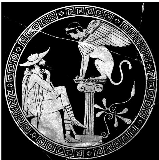
Едип разгадава гатанката на сфинкса