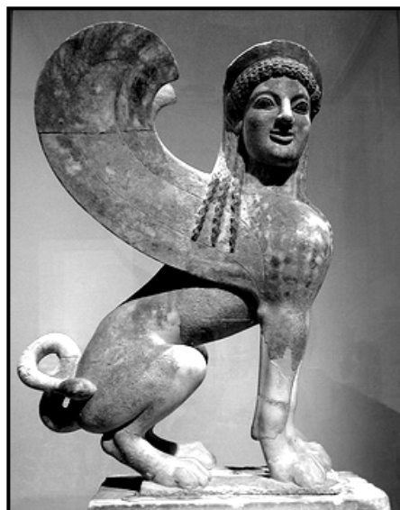
Елинска статуя на сфинкс