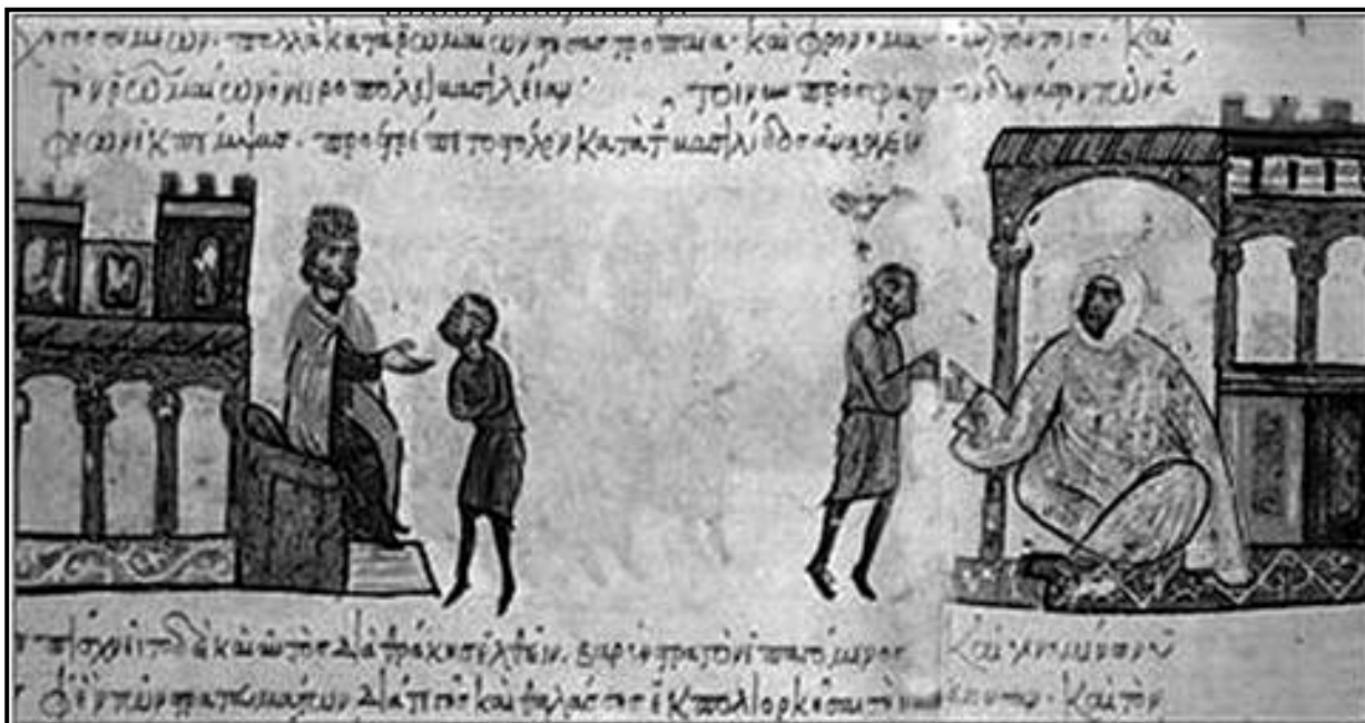
Миниатюра от византийска хроника, XII век

Направете в обем до 2 страници анализ на даденото изображение: