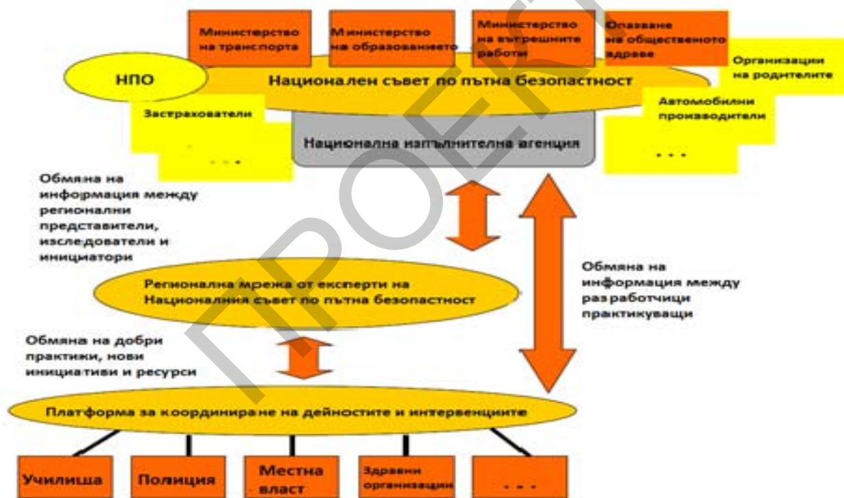
Фигура 2. Координация на системата за образование по безопасност на движението по пътищата

4. Информационният поток трябва да е двупосочен, за да се подобри способността за учене и времето за реакция на системата. Това означава, че координацията, изследванията и управлението трябва да общуват с практикуващите на място и обратно.